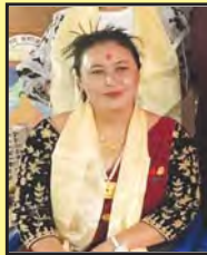
उमाकला गुरुड सदस्य