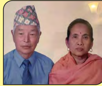
१०४. श्री डाकमान रिल्दी घले तथा डिल्लीमाया गुरुड