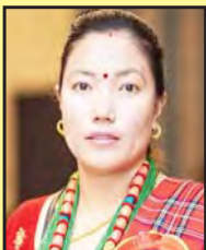
फुलमाया गुरुड सदस्य