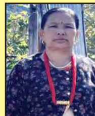
टिकामाया गुरुड सदस्य