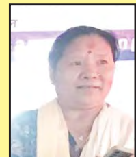
जानुका गुरुड सदस्य