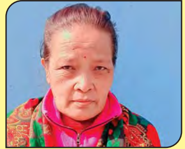
१७१. श्री बिना घले गुरुड