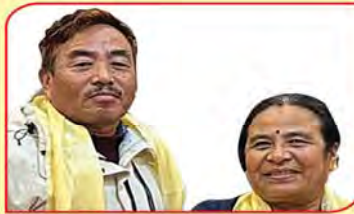
श्री मोला मेधी (मलमान) गुरुड तथा सुन्केसरी गुरुड

हाल : बु.न.पा.-१२, आकासेधारा रु. ५.००.१५५