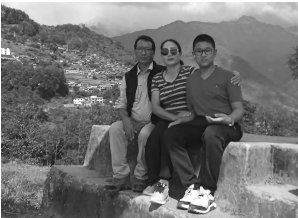
पृष्ठभूमिमा सिक्लेस गाउँ

संयोग पनि कस्तो राम्रो मेरो जन्मस्थान पनि संखुवा सभाको मादी नगरपालिका ७ अनि मेरो पूर्खाको थलो