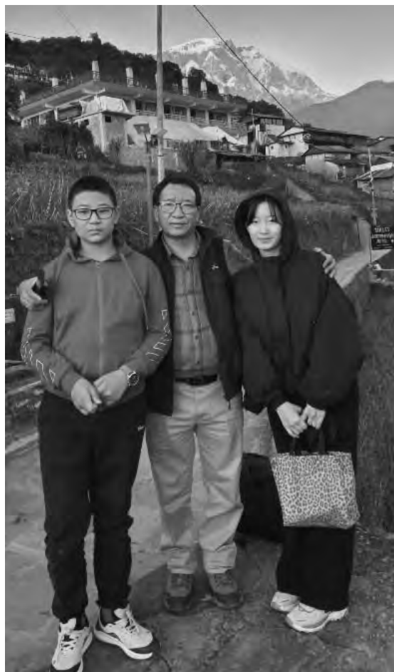
पृष्ठभूमिमा लमजुड हिमाल

हामी आराम गर्थौं । यो गेष्ट हाउस साह्रै राम्रो र सफा रहेछ,