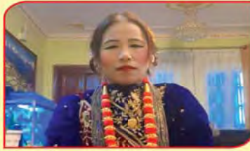
श्री गौमाया गुरुङ खा.न.पा.-४, सेकाहा हाल: बु.न.पा.-५, सुकेधारा रु. ५,१०,५५५