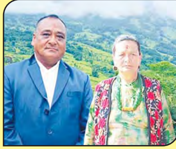
१२२. श्री जापान गुरुड तथा दिल्लीमाया गुरुड