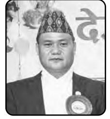
■ भीम गुरुड महासचिव

आदरणीय संखुवासभाली तमू दाजुभाई तथा दिदीबहिनीहरूमा छ्यजालो नमस्कार !